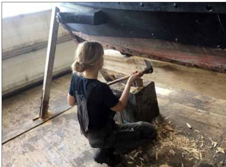
Fintilpasning med skarøkse