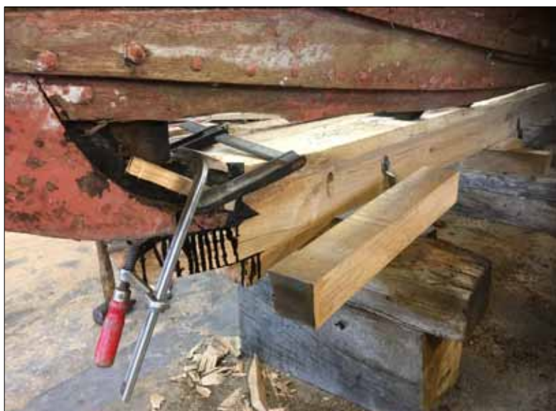
Kølen samles med stævnen

Efterhånden som processen skred frem, var det nødvendigt også at skifte nogle borde, så summa sumarum kom vi helt hen til 27. september, før skibet højtideligt blev afleveret fra værftet til en repræsentant (mig) fra Sebbe als skibslag. Og det var virkelig et godt stykke håndværk de havde lavet.