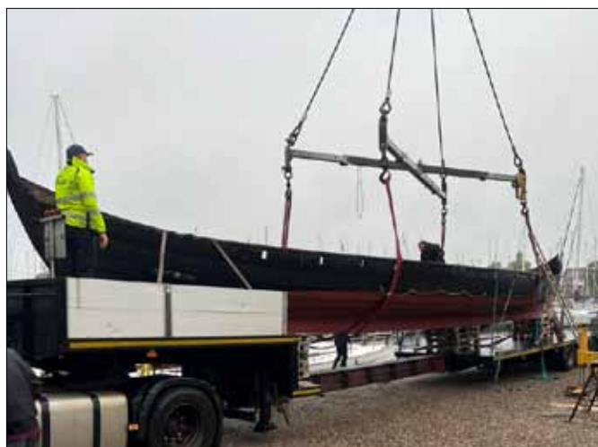
Sebbe kom hjem til Augustenborg 14, oktober