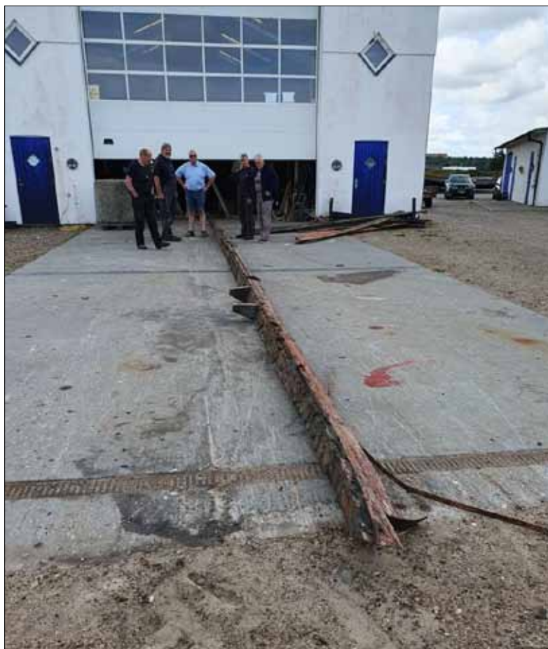
Den gamle køl havde været ny engang