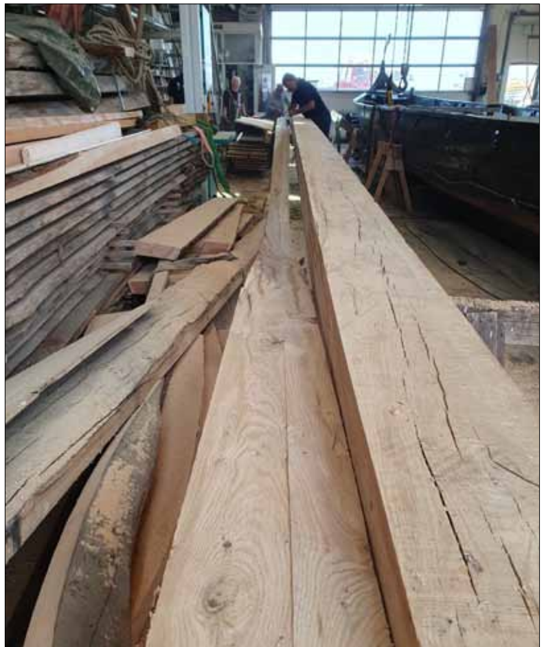
Den nye køl under bearbejdning

Den 2 december 2022 blev Sebbe kørt til Slette strand for at få skiftet kølen m.v. Det viste sig at blive en større historie. Selvom om værftet var specialister i klinkbyggede både, så havde det aldrig skiftet en hel køl på et vikingskib før. Og vikingerne selv byggede jo bare et nyt skib, når skibet blev for gammelt. De blev så brugt til spærringer og lignende, ligesom vores oprindelig skib blev det i Skulderslev (vrag nr. 5).