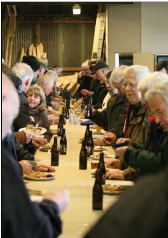
Spisning ved langbord