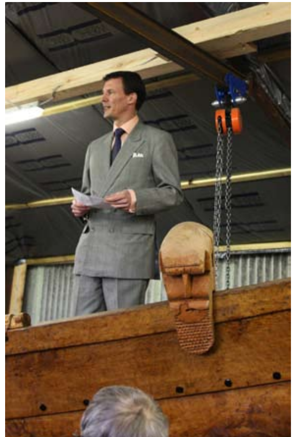
Prinsen holdt sin tale