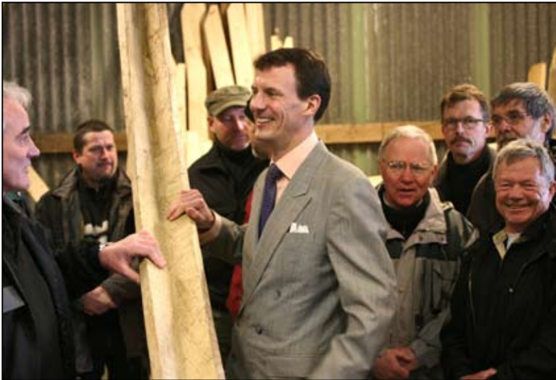
Prins Joakim får en forklaring på byggeriet

I anledning af kølstrækningen var der inviteret medlemmer, VIP / sponsorer og venner. Det blev som altid et fremragende arrangement - roligt, afslappet, enkelt og rigtig hyggeligt.