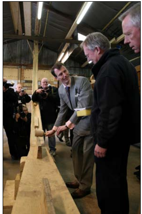
Prinsen bankede også negler i