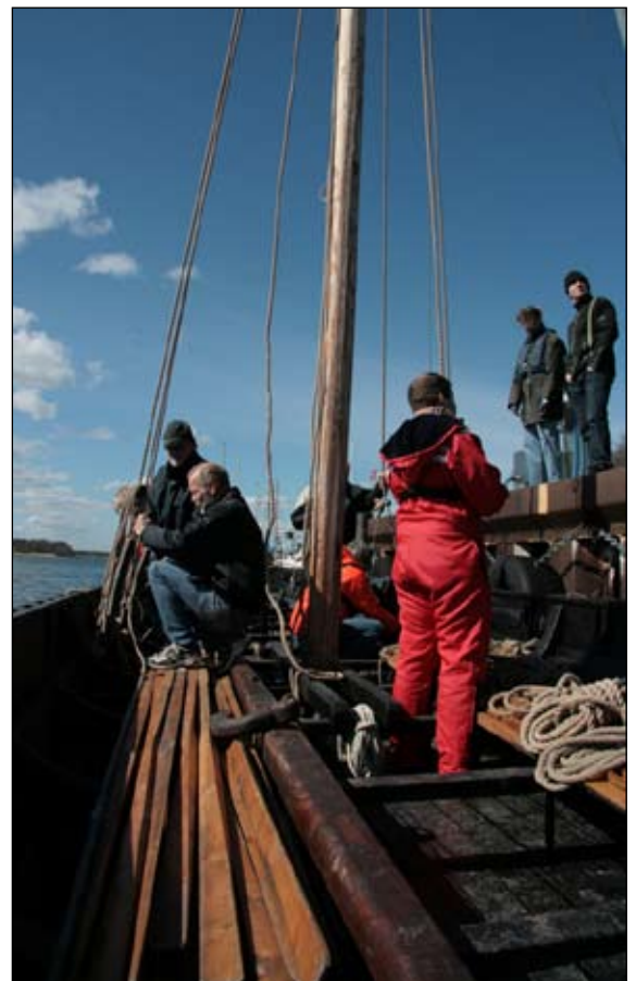
Der bindes og stammes i alle hjørner