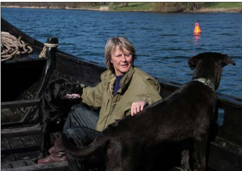
Ikke en, men 2 skibshunde