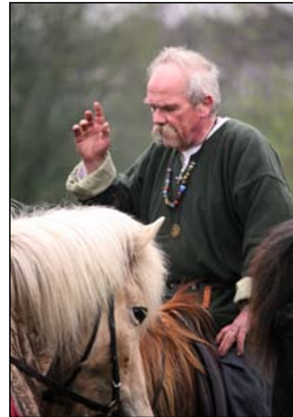
Hesten forsøger at tale efter en flot rideopvisning