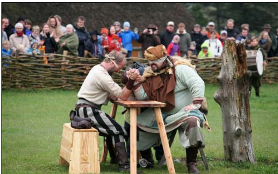
De prustede og stønnede

et fuldt krus øl uden at spille, mens han i almindelig gang taper det hele og det er jo alkoholmisbrug! Efter rideopvisningen var det krigernes tur. Vi