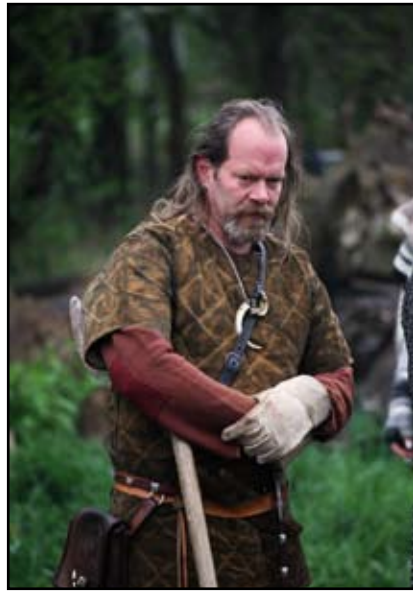
De barske kriger venter på kamp