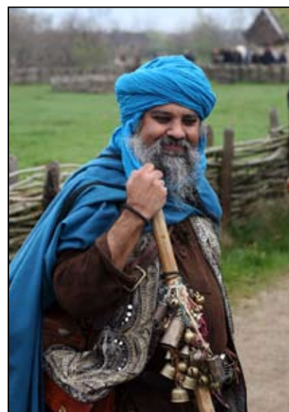
Vikingetid? Middelalder? .....