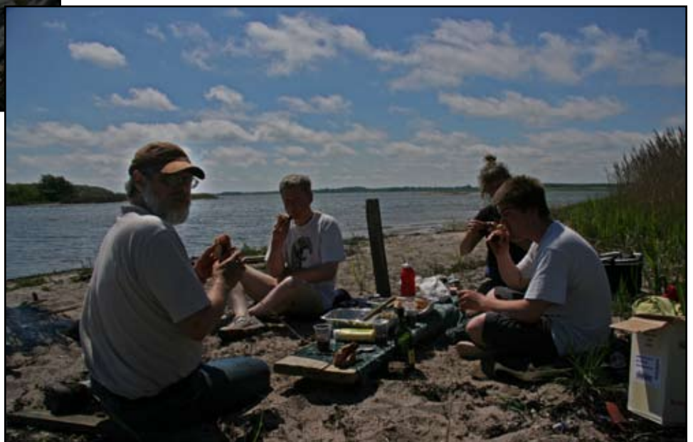
Et godt måltid, et smukt sted i godt selskab - livet er herligt!