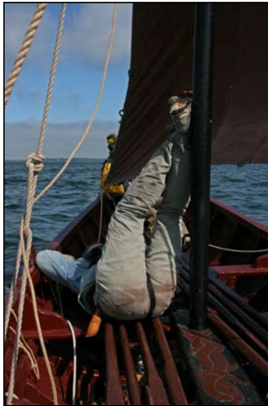
Hvem sagde magelig?

fri igen. Det lykkedes og vi lagde skibet ind i læ i en lille vig. Det havde været en fin sejltur. Så blev der samlet brænde og tændt bål. Der var en der havde