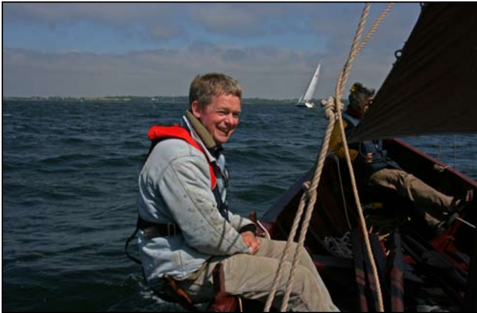
Er være på vandet er at leve

pakkede vi skibet og stak af for årer idet vi havde vinden lige imod. Vi bøvlede temmelig med rorbeslaget og måtte søge læ ved roklubben for at få det på plads. Efter endnu et par minutters roning satte vi sejl og begyndte vore kryds ud af fjorden. Vi havde en frisk vind og det er rigtig noget for os for det giver god fart. Det var også tørvejr og hist og her kiggede solen frem. Det gik rigtig fint indtil roret hoppede af ud for lufthavnen - ned med sejlet og så et heftigt forsøg på at få det på plads igen, men der var for store bølger, så