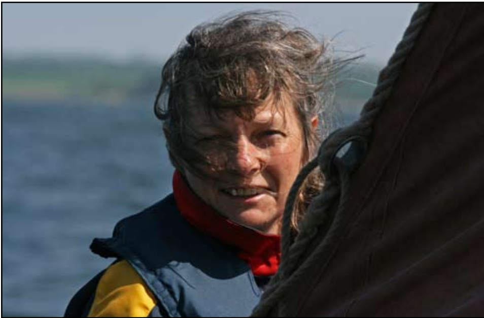
Et fransk smil dukkede op bag sejlet

medbragt fyrstål og gjorde sit bedste, men efter flere forsøg kom de forløsende ord "stik mig en lighter". Da der var gode gløder blev risten lagt på. Forinden var der store diskussioner om hvordan man lavede en holder der kunne holde risten vandret. Efter flere forsøg lagde vi bare risten på gløderne og pølserne ovenpå. Rødvinen blev trukket op og snart var der frisk bagerbrød, pølser med tilbehør og en god rødvin. Når der samtidig er varm og stille - langt fra andre mennesker og med et smukt