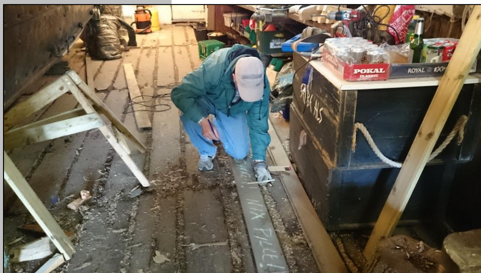
Hr. Materialeforvalter er ikke ret god til at læse – se lige hvad der står med kridt!