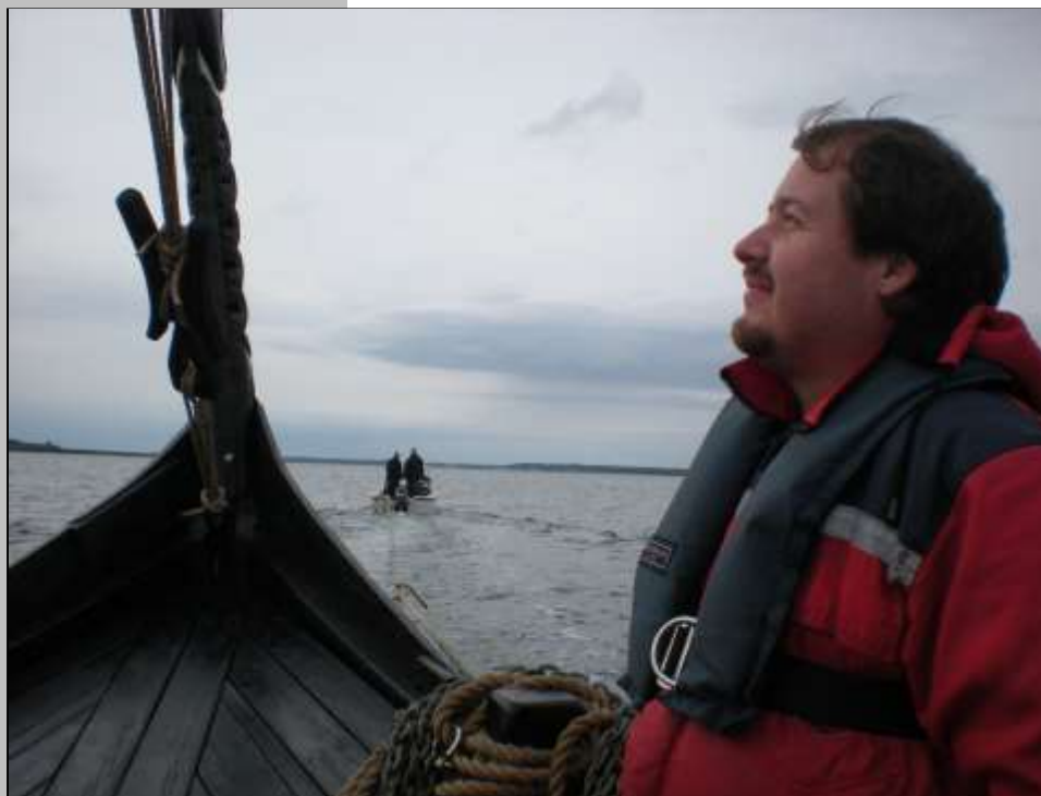
"Sikke en fin byge der er på vej der"

...Det sku' jo prøves igen! Torsdag sidst på eftermiddagen fik vi en lille besætning på Sebbe, plus et tomandshold ovre på Fie. Lidt roden og pillen, og så ud af havnen i rimelig vind og acceptabelt godt vejr - en lille byge blev det da til. Ind i Sønderborg havn og gjort fast ved 'petroleumskajen'.