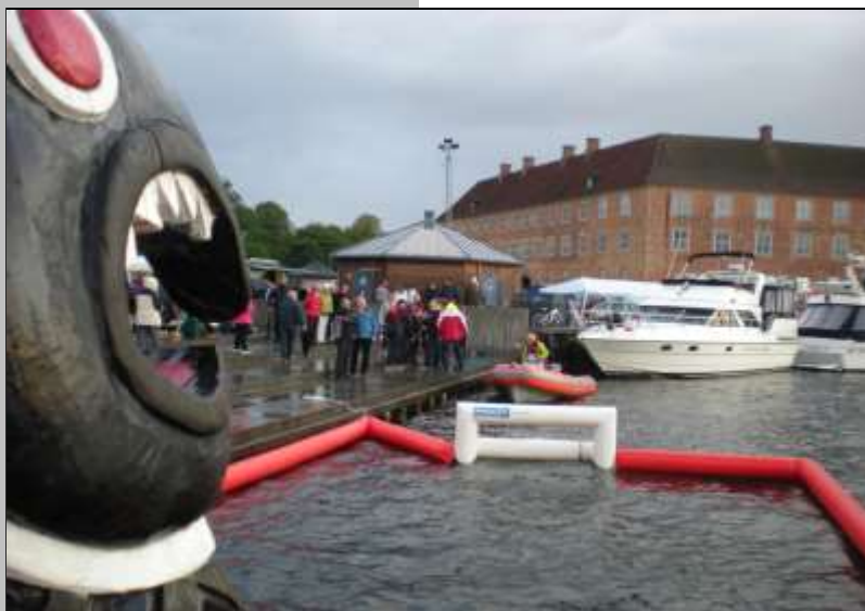
Sebbe parat til at bide fra sig hvis nogen kommer for tæt på!

Og så blev det skaffetid. Det blev til en lille invasion af Italistan... det var ihvertfald hvad