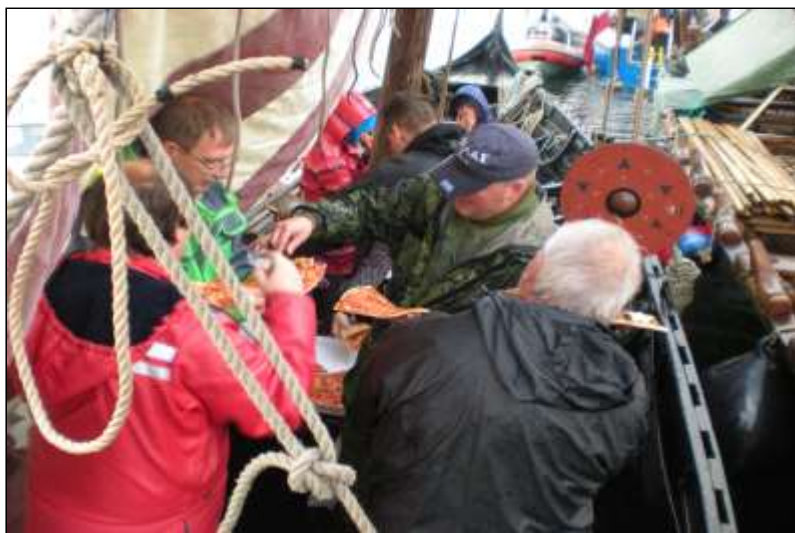
Pizza della HATHBARP

Oven i købet slap vi for at skulle ro/slæbe Sebbe over på strømsiden af havnen for natten - Nydam-folket havde udnævnt en nattevagt, der blev på Tveir hele natten over, så de tilbød at vi bare kunne lade Sebbe ligge natten over! Vi tog imod med tak, og benyttede lejligheden til at holde udstillingen åben lidt længere end vi plejer.