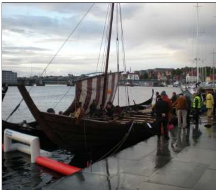
Når jernalder og vikingevalder mødes