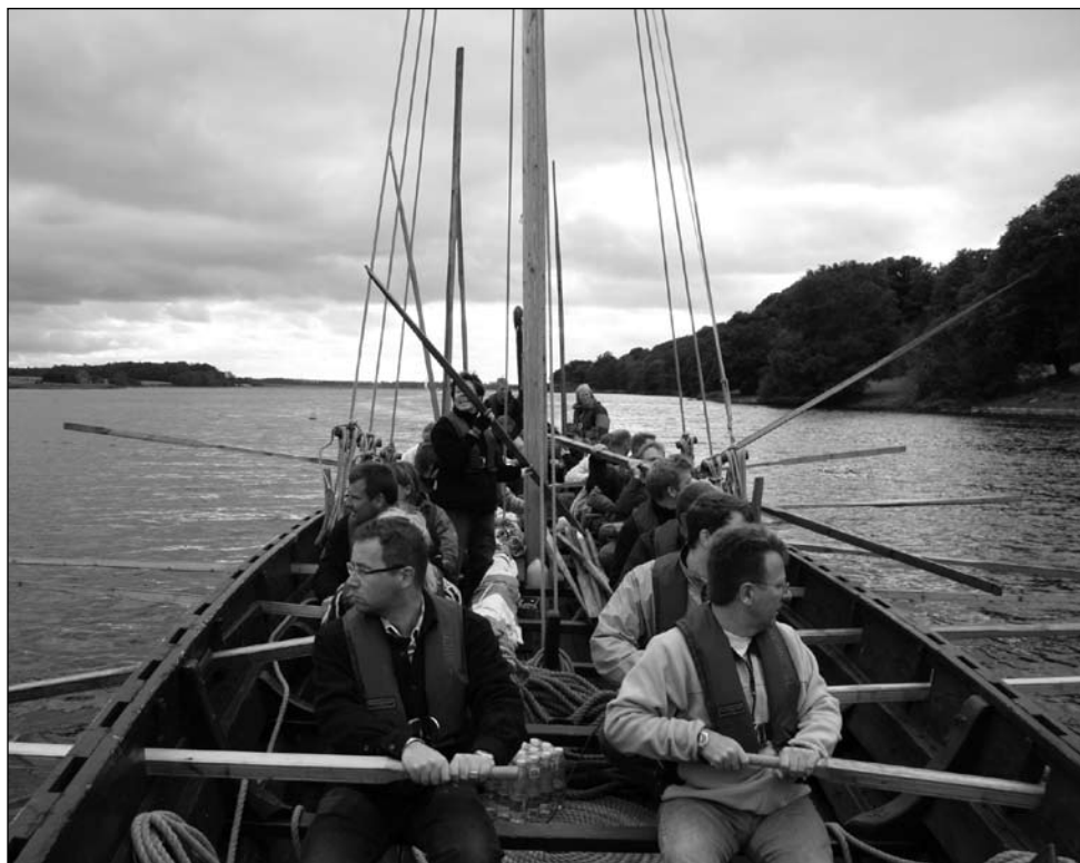
Fra en af turene sommeren 2007

Resterende dagsorden afbrydes, da den grundet ovenstående ikke kan gennemføres. Generalforsamlingen blev opløst i god ro og orden.