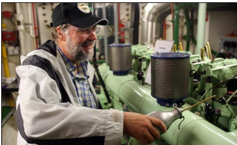
Et sebbemedlem tog sig tid til at smøre motoren på et naboskib