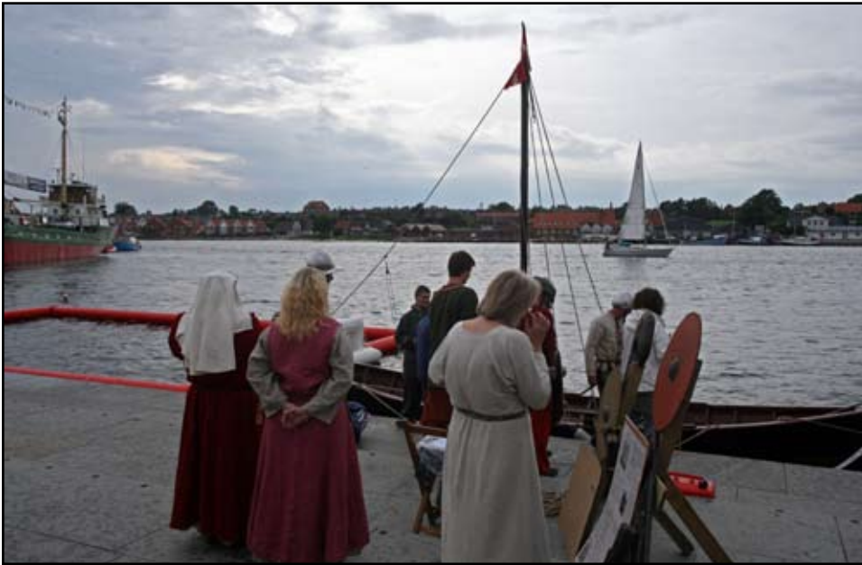
Middelalderfolket kom på besøg