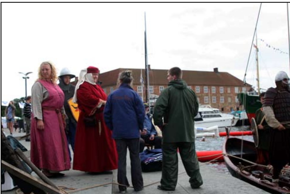
Vikingetid kommunikerer med middelalder

Som mange andre foreninger var vi inviteret til Kulturnat i Sønderborg og, ja det kunne bestemt ikke skade og det gav endnu en tur.