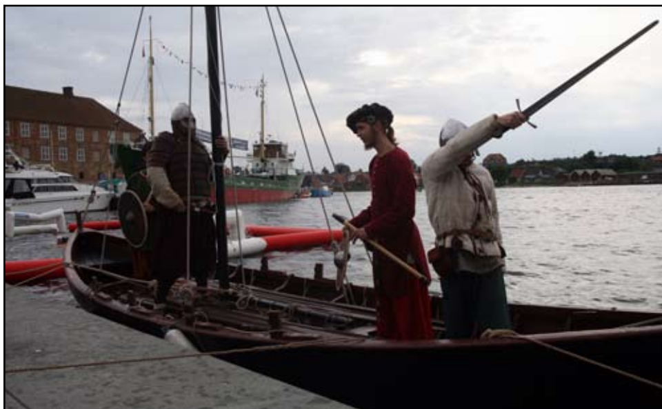
Ottar - et trækplaster for middelalderen

rigtig fin sejltur var slut da vi strøg sejlet 50 m før Ottars liggeplads.